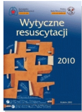
Wytyczne resuscytacji 2010

KRAKOWSKI SZPITAL SPECJALISTYCZNY IM. JANA PAWŁA II