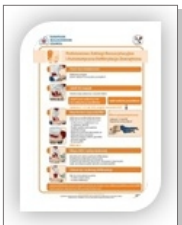
Postery wymiary: (w centymetrach: 69 x 48)

Podręczniki do nabycia poprzez stronę http://www.prc.krakow.pl/wyd/wyd.htm lub bezpośrednio w siedzibie w godzinach od 8:00 - 15:00 pod adresem :