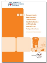
Resuscytacja krążeniowo-oddechowa i automatyczna defibrylacja zewnętrzna