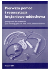
Pierwsza pomoc i resuscytacja krążeniowo-oddechowa